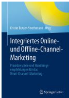
Integriertes Online- und Offline-Channel-Marketing Ladenpreis: 66,81EUR

Wir haben andere Produkte gefunden, die Ihnen gefallen könnten!