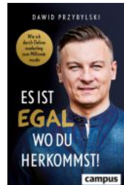
Es ist egal, wo du herkommst! Ladenpreis: 22,70EUR