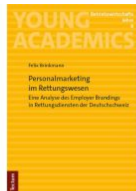
Personalmarketing im Rettungswesen Ladenpreis: 60,70EUR