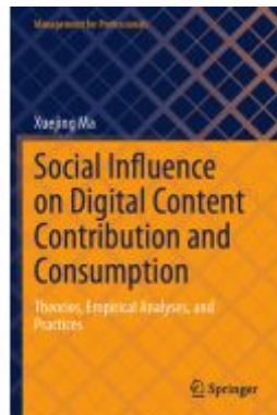
Social Influence on Digital Content Contribution and Consumption Ladenpreis: 54,99EUR