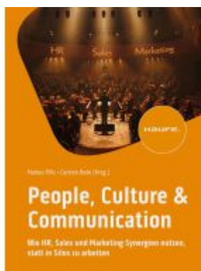
People, Culture & Communication Ladenpreis: 92,60EUR