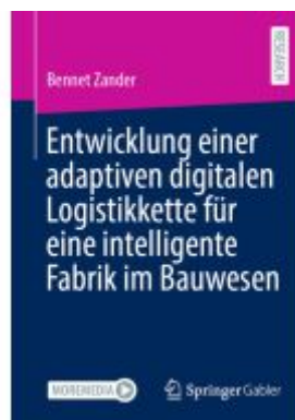
Entwicklung einer adaptiven digitalen Logistikkette für eine intelligente Fabrik im Bauwesen Ladenpreis: 77,09EUR