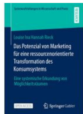
Das Potenzial von Marketing für eine ressourcenorientierte Transformation des Konsumsystems Ladenpreis: 43,99EUR