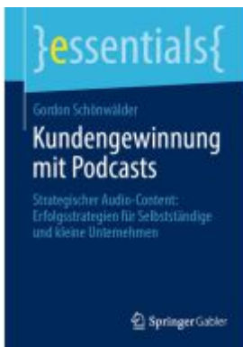
Kundengewinnung mit Podcasts Ladenpreis: 15,41EUR