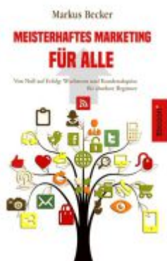
Meisterhaftes Marketing für alle Ladenpreis: 29,90EUR