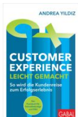
Customer Experience leicht gemacht Ladenpreis: 28,80EUR