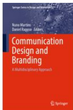
Communication Design and Branding Ladenpreis: 175,99EUR