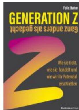
Generation Z – Ganz anders als gedacht Ladenpreis: 25,70EUR