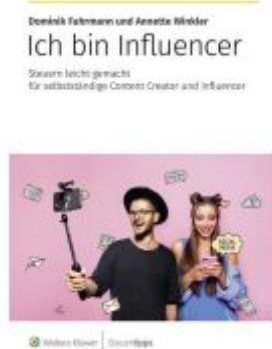
Ich bin Influencer Ladenpreis: 20,60EUR