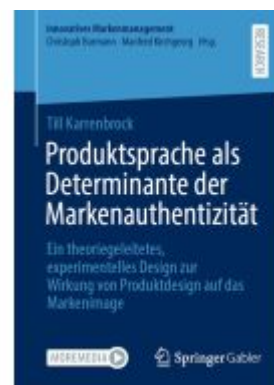
Produktsprache als Determinante der Markenauthenzität Ladenpreis: 82,24EUR