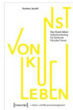
Von Kunst leben Ladenpreis: 27,00EUR