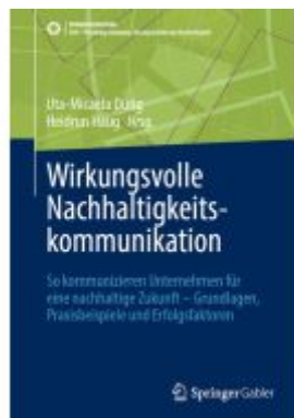
Wirkungsvolle Nachhaltigkeitskommunikation Ladenpreis: 61,67EUR