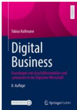
Digital Business Ladenpreis: 61,68EUR

Wir haben andere Produkte gefunden, die Ihnen gefallen könnten!