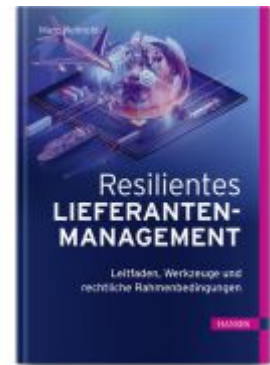
Resilientes Lieferantenmanagement Ladenpreis: 72,00EUR