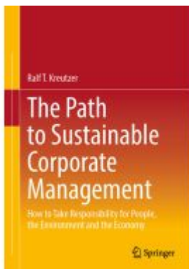
The Path to Sustainable Corporate Management Ladenpreis: 76,99EUR