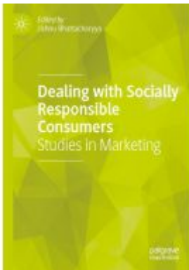
Dealing with Socially Responsible Consumers Ladenpreis: 71,49EUR