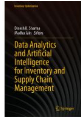
Data Analytics and Artificial Intelligence for Inventory and Supply Chain Management Ladenpreis: 164,99EUR