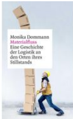
Materialfluss Ladenpreis: 28,80EUR