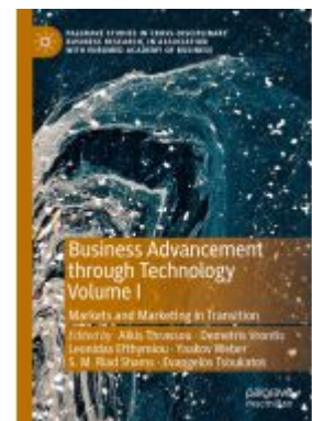
Business Advancement through Technology Volume I Ladenpreis: 175,99EUR