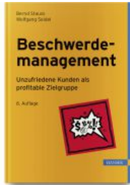
Beschwerdemanagement Ladenpreis: 61,70EUR