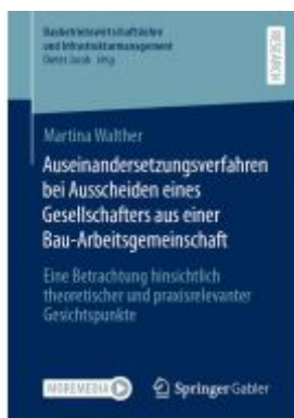
Auseinandersetzungsverfahren bei Ausscheiden eines Gesellschafters aus einer Bau-Arbeitsgemeinschaft Ladenpreis: 66,81EUR