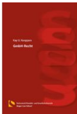
GmbH-Recht Ladenpreis: 25,70EUR