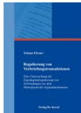
Regulierung von Verbriefungstransaktionen Ladenpreis: 154,00EUR