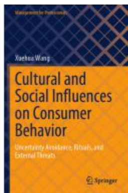
Cultural and Social Influences on Consumer Behavior