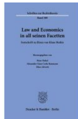
Law and Economics in all seinen Facetten.