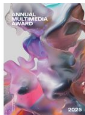
Annual Multimedia 2025 Ladenpreis: 79,00EUR