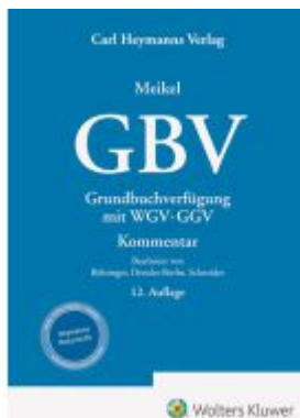
GBV Grundbuchverfügung mit WGV und GGV Ladenpreis: 132,70EUR

Wir haben andere Produkte gefunden, die Ihnen gefallen könnten!