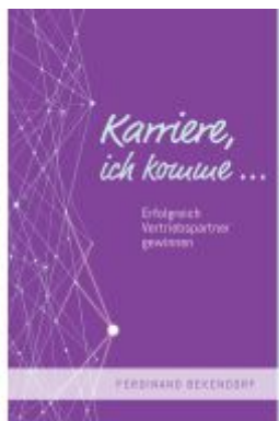
Karriere, ich komme...