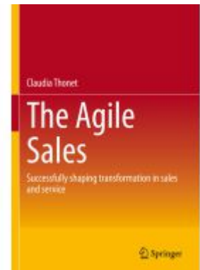
The Agile Sales Ladenpreis: 71,49EUR