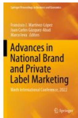
Advances in National Brand and Private Label Marketing Ladenpreis: 164,99EUR