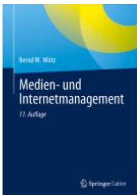
Medien- und Internetmanagement Ladenpreis: 77,09EUR