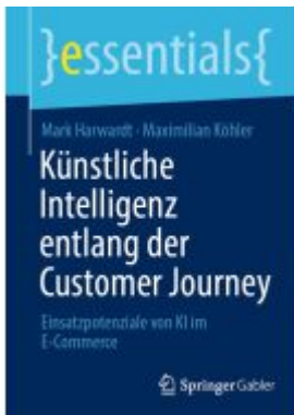
Künstliche Intelligenz entlang der Customer Journey Ladenpreis: 15,41EUR

Wir haben andere Produkte gefunden, die Ihnen gefallen könnten!