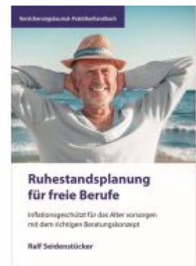
Ruhestandsplanung für freie Berufe Ladenpreis: 29,90EUR