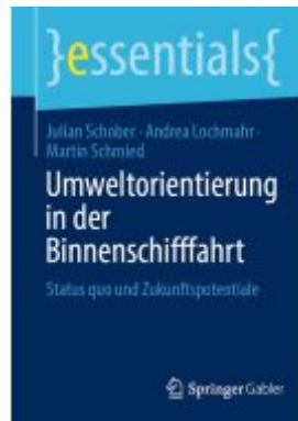
Umweltorientierung in der Binnenschifffahrt Ladenpreis: 15,41EUR