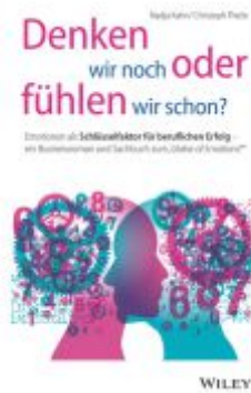
Denken wir noch oder fühlen wir schon? Ladenpreis: 25,70EUR