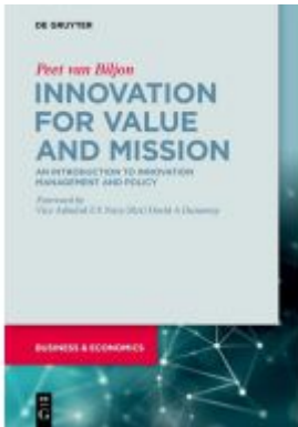
Innovation for Value and Mission Ladenpreis: 34,95EUR