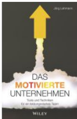
Das motivierte Unternehmen Ladenpreis: 25,70EUR

Wir haben andere Produkte gefunden, die Ihnen gefallen könnten!