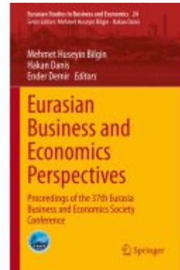
Eurasian Business and Economics Perspectives Ladenpreis: 219,99EUR