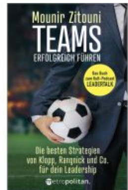
Teams erfolgreich führen Ladenpreis: 25,70EUR