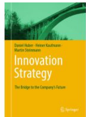
Innovation Strategy Ladenpreis: 87,99EUR