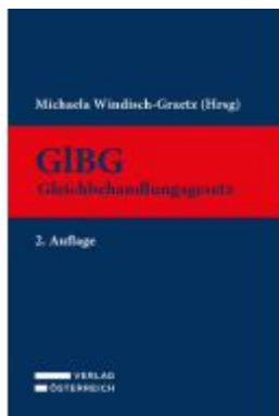
Gleichbehandlungsgesetz - GIBG Ladenpreis: 249,00EUR