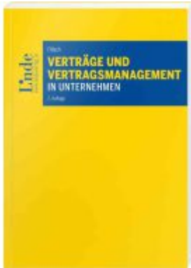
Verträge und Vertragsmanagement in Unternehmen Ladenpreis: 64,00EUR