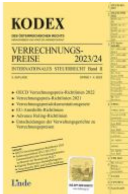
KODEX Verrechnungspreise 2023/24 Ladenpreis: 63,00EUR