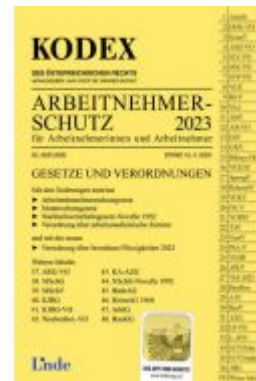
KODEX Arbeitnehmerschutz 2023 Ladenpreis: 41,00EUR