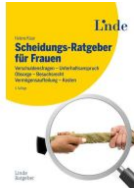
Scheidungs-Ratgeber für Frauen Ladenpreis: 29,90EUR