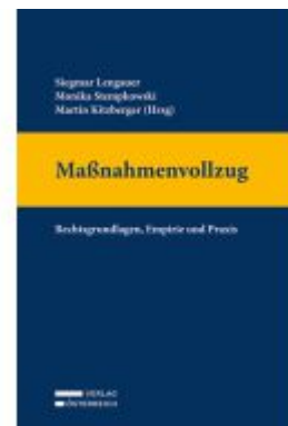
Maßnahmenvollzug Ladenpreis: 119,00EUR