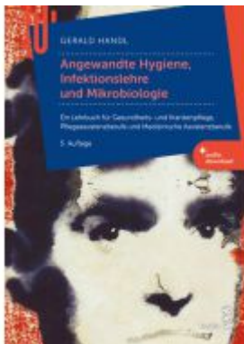
Angewandte Hygiene, Infektionslehre und Mikrobiologie Ladenpreis: 38,90EUR

Wir haben andere Produkte gefunden, die Ihnen gefallen könnten!