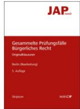
JAP - Gesammelte Prüfungsfälle Bürgerliches Recht Ladenpreis: 36,00EUR