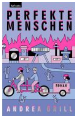
Perfekte Menschen Ladenpreis: 24,50EUR