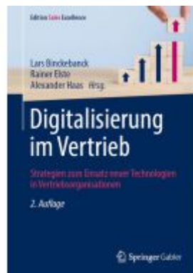
Digitalisierung im Vertrieb Ladenpreis: 77,09EUR