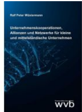
Unternehmenskooperationen, Allianzen und Netzwerke für kleine und mittelständische Unternehmen Ladenpreis: 57,60EUR