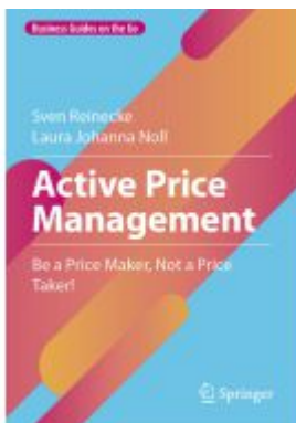
Active Price Management Ladenpreis: 41,79EUR