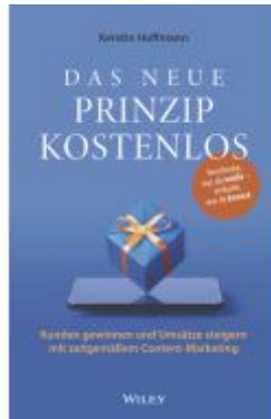
Das neue Prinzip kostenlos Ladenpreis: 25,70EUR