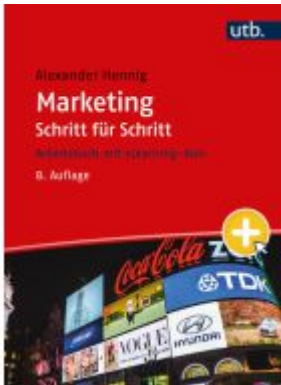
Marketing Schritt für Schritt Ladenpreis: 33,90EUR