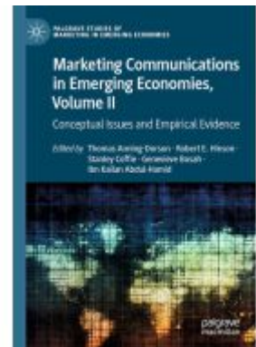
Marketing Communications in Emerging Economies, Volume II Ladenpreis: 164,99EUR