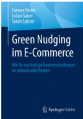
Green Nudging im E-Commerce Ladenpreis: 46,26EUR