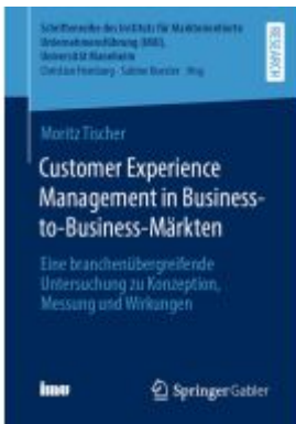
Customer Experience Management in Business-to-Business-Märkten Ladenpreis: 71,95EUR