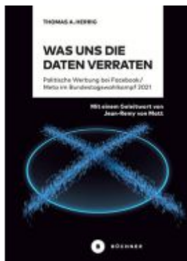
Was uns die Daten verraten Ladenpreis: 25,00EUR