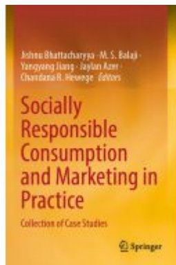
Socially Responsible Consumption and Marketing in Practice Ladenpreis: 153,99EUR