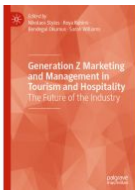
Generation Z Marketing and Management in Tourism and Hospitality Ladenpreis: 197,99EUR