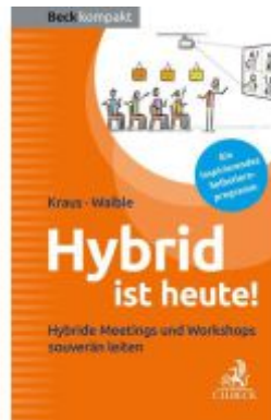
Hybrid ist heute! Ladenpreis: 10,20EUR