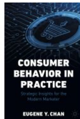
Consumer Behavior in Practice Ladenpreis: 71,49EUR