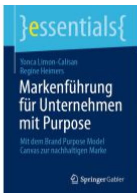
Markenführung für Unternehmen mit Purpose Ladenpreis: 15,41EUR