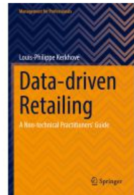
Data-driven Retailing Ladenpreis: 54,99EUR