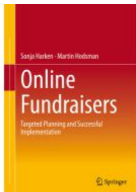
Online Fundraisers Ladenpreis: 71,49EUR