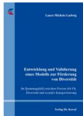
Entwicklung und Validierung eines Modells zur Förderung von Diversität Ladenpreis: 89,30EUR