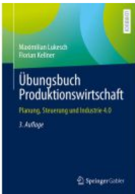
Übungsbuch Produktionswirtschaft Ladenpreis: 39,06EUR