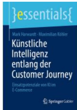
Künstliche Intelligenz entlang der Customer Journey Ladenpreis: 15,41EUR