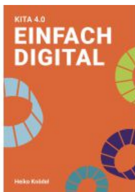
Kita 4.0 – einfach digital Ladenpreis: 20,60EUR