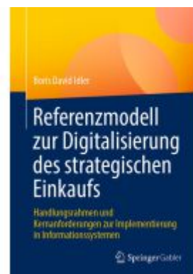
Referenzmodell zur Digitalisierung des strategischen Einkaufs Ladenpreis: 39,06EUR