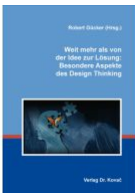
Weit mehr als von der Idee zur Lösung: Besondere Aspekte des Design Thinking Ladenpreis: 79,10EUR