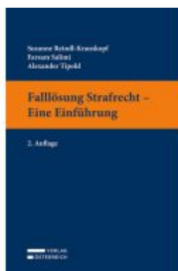
Falllösung Strafrecht - Eine Einführung Ladenpreis: 32,00EUR