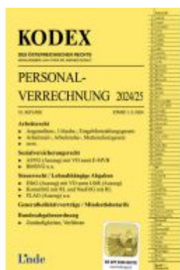
KODEX Personalverrechnung 2024/25 Ladenpreis: 45,00EUR