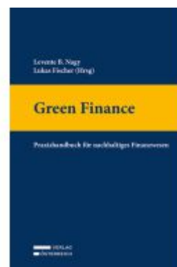
Green Finance Ladenpreis: 69,00EUR