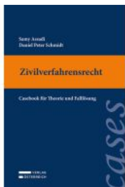
Zivilverfahrensrecht Ladenpreis: 39,00EUR