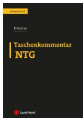
Taschenkommentar NTG Ladenpreis: 42,00EUR