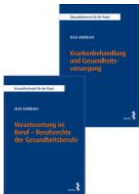
Kombipaket Verantwortung im Beruf – Berufsrechte der Gesundheitsberufe sowie Krankenbehandlung und Gesundheitsversorgung Ladenpreis: 59,00EUR