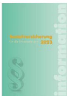
Sozialversicherung 2023 Ladenpreis: 49,50EUR