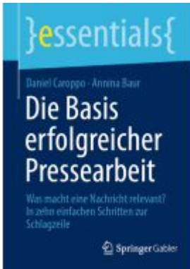
Die Basis erfolgreicher Pressearbeit Ladenpreis: 15,41EUR

Wir haben andere Produkte gefunden, die Ihnen gefallen könnten!