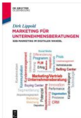
Marketing für Unternehmensberatungen Ladenpreis: 24,95EUR