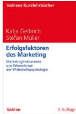
Erfolgsfaktoren des Marketing Ladenpreis: 25,60EUR