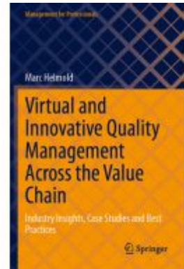
Virtual and Innovative Quality Management Across the Value Chain Ladenpreis: 76,99EUR