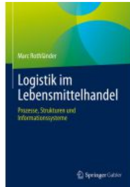
Logistik im Lebensmittelhandel Ladenpreis: 56,53EUR