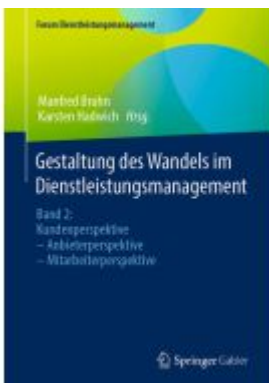
Gestaltung des Wandels im Dienstleistungsmanagement Ladenpreis: 164,47EUR