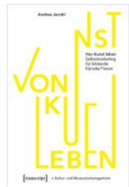
Von Kunst leben Ladenpreis: 27,00EUR