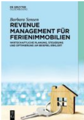
Revenue Management für Ferienimmobilien Ladenpreis: 24,95EUR