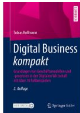
Digital Business kompakt Ladenpreis: 41,11EUR