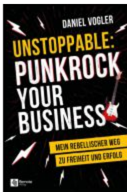
Unstoppable: Punkrock your Business Ladenpreis: 21,99EUR