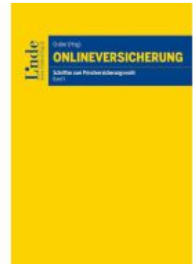
Onlineversicherung Ladenpreis: 38,00EUR