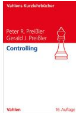
Controlling Ladenpreis: 30,70EUR