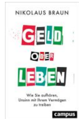
Geld oder Leben Ladenpreis: 26,90EUR