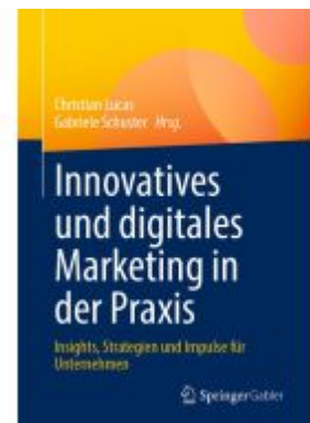
Innovatives und digitales Marketing in der Praxis Ladenpreis: 61,68EUR