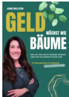
Geld wächst wie Bäume Ladenpreis: 20,50EUR