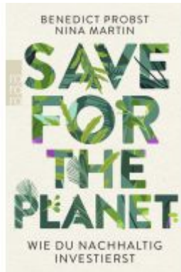
Save for the Planet Ladenpreis: 14,40EUR