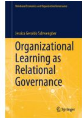
Organizational Learning as Relational Governance Ladenpreis: 120,99EUR