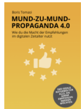
Mund zu Mund Propaganda 4.0 Ladenpreis: 24,95EUR