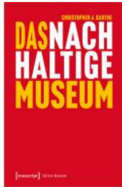
Das nachhaltige Museum Ladenpreis: 39,00EUR