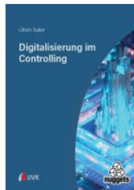
Digitalisierung im Controlling Ladenpreis: 18,50EUR