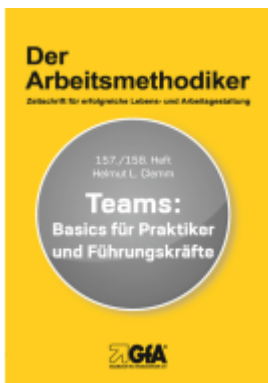
Teams: Ladenpreis: 20,40EUR