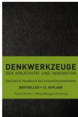
Denkwerkzeuge Ladenpreis: 25,70EUR

Wir haben andere Produkte gefunden, die Ihnen gefallen könnten!