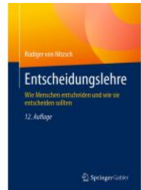
Entscheidungslehre Ladenpreis: 39,06EUR