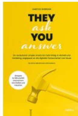
They ask you answer Ladenpreis: 30,70EUR