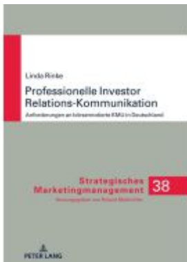
Professionelle Investor Relations-Kommunikation Ladenpreis: 63,70EUR