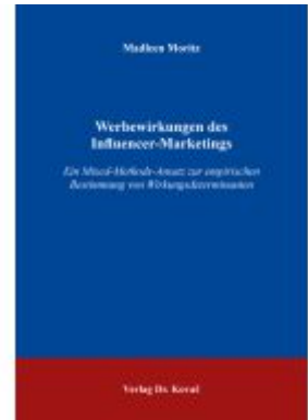
Werbewirkungen des Influencer-Marketings Ladenpreis: 102,60EUR