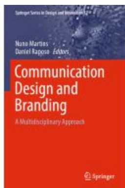
Communication Design and Branding Ladenpreis: 175,99EUR