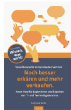
Noch besser erklären und mehr verkaufen. Ladenpreis: 19,50EUR