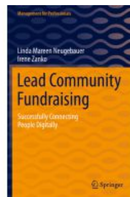
Lead Community Fundraising Ladenpreis: 54,99EUR