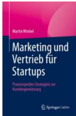
Marketing und Vertrieb für Startups Ladenpreis: 41,11EUR