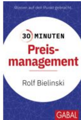
30 Minuten Preismanagement Ladenpreis: 11,30EUR