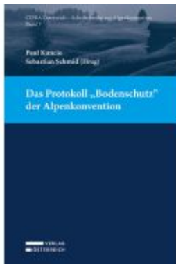
Das Protokoll „Bodenschutz“ der Alpenkonvention Ladenpreis: 45,00EUR