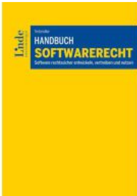
Handbuch Softwarerecht Ladenpreis: 88,00EUR