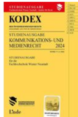
KODEX Studienausgabe Kommunikations- und Medienrecht Ladenpreis: 18,00EUR