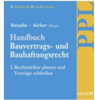
Handbuch Bauvertrags- und Bauhaftungsrecht Band I: Rechtssicher Planen Ladenpreis: 148,00EUR