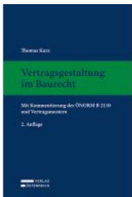
Vertragsgestaltung im Baurecht Ladenpreis: 159,00EUR