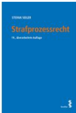
Strafprozessrecht Ladenpreis: 38,00EUR

Wir haben andere Produkte gefunden, die Ihnen gefallen könnten!