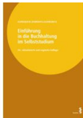
Einführung in die Buchhaltung im Selbststudium Ladenpreis: 52,00EUR