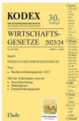
KODEX Wirtschaftsgesetze Band I 2023/24 Ladenpreis: 62,00EUR