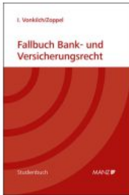
Fallbuch Bank- und Versicherungsrecht Ladenpreis: 27,00EUR