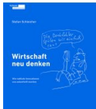
Wirtschaft neu denken Ladenpreis: 25,00EUR