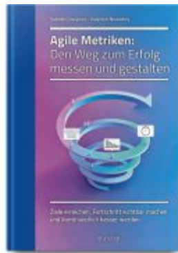
Agile Metriken: Den Weg zum Erfolg messen und gestalten Ladenpreis: 51,40EUR