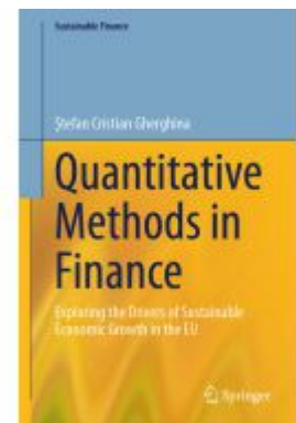
Quantitative Methods in Finance Ladenpreis: 120,99EUR