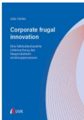
Corporate frugal innovation: Eine fallstudienbasierte Untersuchung des Neuproduktentwicklungsprozesses Ladenpreis: 60,80EUR