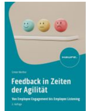
Feedback in Zeiten der Agilität Ladenpreis: 46,30EUR