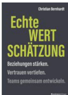
Echte Wertschätzung Ladenpreis: 30,80EUR