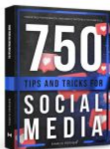
750 Tips and Tricks for Social Media Ladenpreis: 19,90EUR