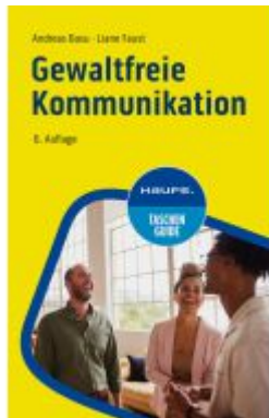
Gewaltfreie Kommunikation Ladenpreis: 12,40EUR