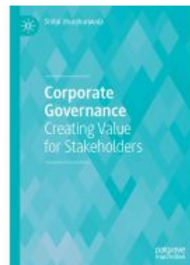
Corporate Governance Ladenpreis: 65,99EUR