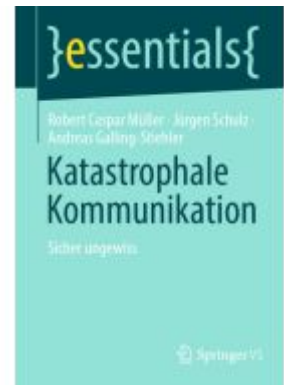
Katastrophale Kommunikation Ladenpreis: 15,41EUR