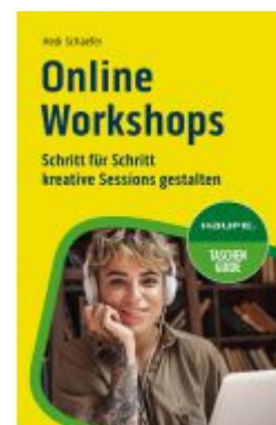
Online-Workshops Ladenpreis: 10,30EUR