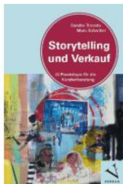
Storytelling und Verkauf Ladenpreis: 19,90EUR