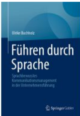
Führen durch Sprache Ladenpreis: 46,15EUR