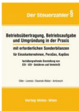
Betriebsübertragung, Betriebsaufgabe und Umgründung in der Praxis Ladenpreis: 82,50EUR

Wir haben andere Produkte gefunden, die Ihnen gefallen könnten!