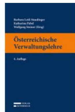
Österreichische Verwaltungslehre Ladenpreis: 49,00EUR

Alle Preise inkl. MwSt. zzgl. Versand. Bei Bestellung im LexisNexis Onlineshop kostenloser Versand innerhalb Österreichs.