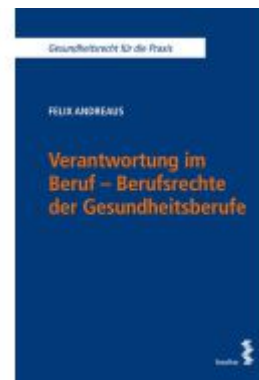
Verantwortung im Beruf - Berufsrechte der Gesundheitsberufe Ladenpreis: 42,00EUR