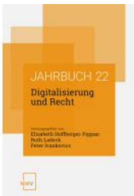
Digitalisierung und Recht Ladenpreis: 84,00EUR