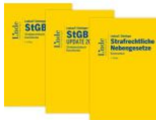
Paket - Leukauf/Steinger StGB inkl. Update 2020 + Strafrechtliche Nebengesetze Ladenpreis: 398,00EUR