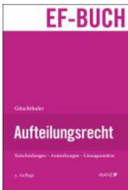
Aufteilungsrecht Ladenpreis: 128,00EUR

Wir haben andere Produkte gefunden, die Ihnen gefallen könnten!