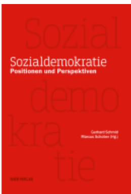
Sozialdemokratie Ladenpreis: 29,90EUR