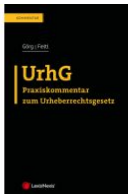
UrhG Ladenpreis: 124,00EUR