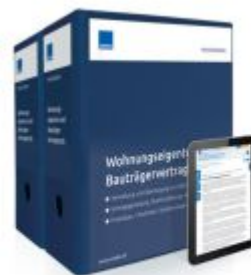
Wohnungseigentum und Bauträgervertragsrecht Ladenpreis: 261,80EUR