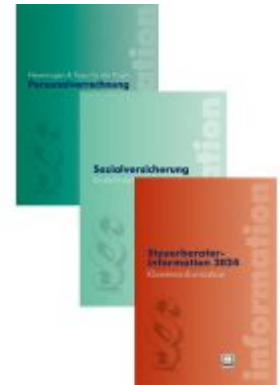
Steuerrechts-Paket 2024 Ladenpreis: 126,50EUR