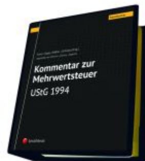
Kommentar zur Mehrwertsteuer - UStG 1994 Ladenpreis: 825,00EUR