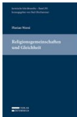
Religionsgemeinschaften und Gleichheit Ladenpreis: 145,00EUR