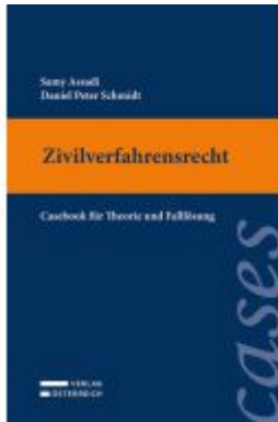
Zivilverfahrensrecht Ladenpreis: 39,00EUR