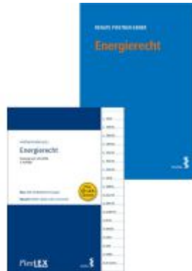
Kombipaket Energierecht und FlexLex Energie recht Ladenpreis: 48,00EUR