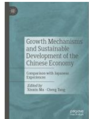
Growth Mechanisms and Sustainable Development of the Chinese Economy Ladenpreis: 164,99EUR