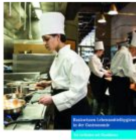
Basiswissen Lebensmittelhygiene in der Gastronomie Ladenpreis: 7,20EUR