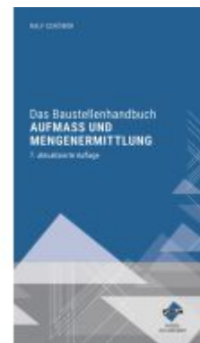
Das Baustellenhandbuch Aufmaß und Mengenermittlung Ladenpreis: 132,70EUR