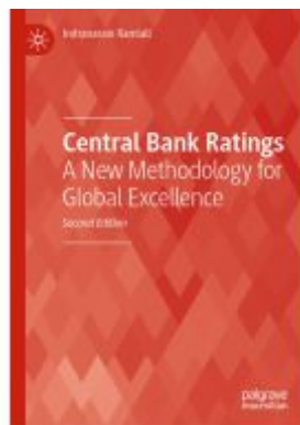
Central Bank Ratings Ladenpreis: 120,99EUR