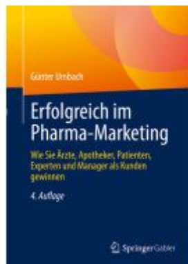
Erfolgreich im Pharma-Marketing Ladenpreis: 61,68EUR