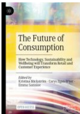
The Future of Consumption Ladenpreis: 43,99EUR