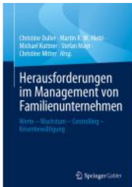
Herausforderungen im Management von Familienunternehmen Ladenpreis: 51,39EUR

Wir haben andere Produkte gefunden, die Ihnen gefallen könnten!