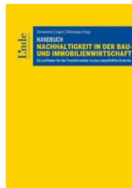
Handbuch Nachhaltigkeit in der Bau- und Immobilienwirtschaft Ladenpreis: 98,00EUR