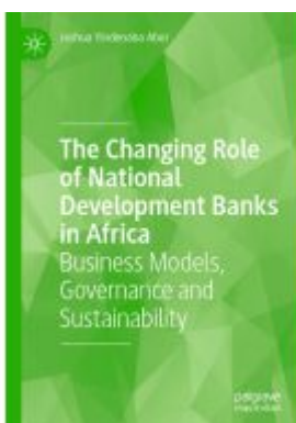
The Changing Role of National Development Banks in Africa Ladenpreis: 142,99EUR