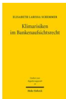
Klimarisiken im Bankenaufsichtsrecht Ladenpreis: 112,10EUR