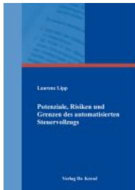
Potenziale, Risiken und Grenzen des automatisierten Steuervollzugs Ladenpreis: 133,50EUR