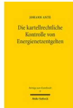
Die kartellrechtliche Kontrolle von Energienetzentgelten Ladenpreis: 81,30EUR