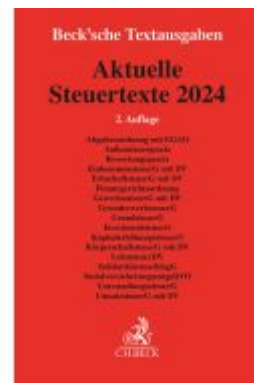
Aktuelle Steuertexte 2024 Ladenpreis: 12,30EUR