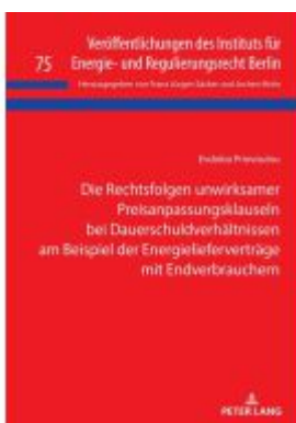
Die Rechtsfolgen unwirksamer Preisanpassungsklauseln bei Dauerschuldverhältnissen am Beispiel der Energielieferverträge mit Endverbrauchern Ladenpreis: 66,80EUR