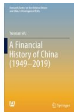
A Financial History of China (1949-2019) Ladenpreis: 131,99EUR