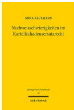
Nachweisschwierigkeiten im Kartellschadensersatzrecht Ladenpreis: 81,30EUR