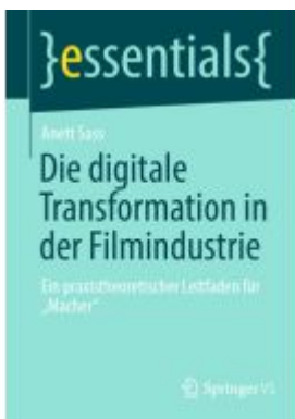
Die digitale Transformation in der Filmindustrie Ladenpreis: 15,41EUR