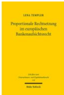
Proportionale Rechtsetzung im europäischen Bankenaufsichtsrecht Ladenpreis: 86,40EUR

Wir haben andere Produkte gefunden, die Ihnen gefallen könnten!