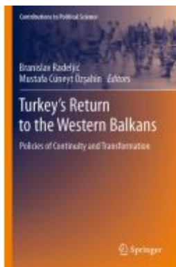
Turkey's Return to the Western Balkans Ladenpreis: 142,99EUR