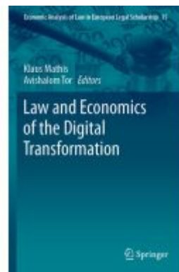
Law and Economics of the Digital Transformation Ladenpreis: 219,99EUR