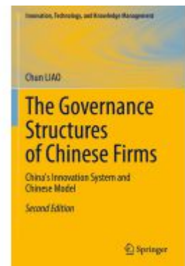
The Governance Structures of Chinese Firms Ladenpreis: 131,99EUR