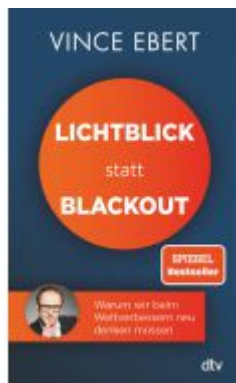
Lichtblick statt Blackout Ladenpreis: 15,50EUR