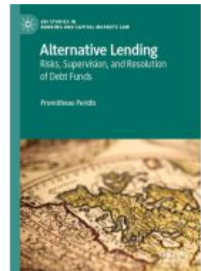
Alternative Lending Ladenpreis: 109,99EUR