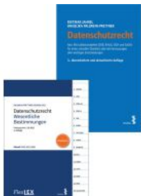
Kombipaket Datenschutzrecht und FlexLex Datenschutzrecht – Wesentliche Bestimmungen Ladenpreis: 38,00EUR