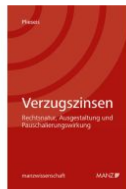
Verzugszinsen Ladenpreis: 74,00EUR