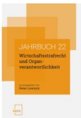
Wirtschaftsstrafrecht und Organverantwortlichkeit Ladenpreis: 68,00EUR