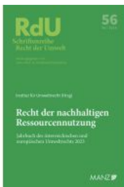
Recht der nachhaltigen Ressourcennutzung Jahrbuch des österreichischen und europäischen Umweltrechts 2023 Ladenpreis: 58,00EUR