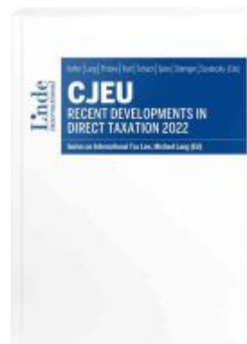
CJEU - Recent Developments in Direct Taxation 2022 Ladenpreis: 85,00EUR