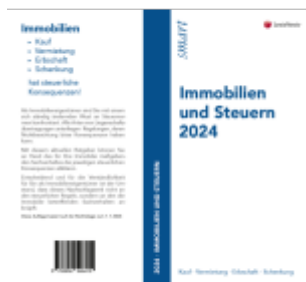
Immobilien und Steuern 2024 Ladenpreis: 14,00EUR