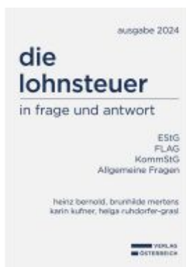
die lohnsteuer in frage und antwort Ladenpreis: 149,00EUR