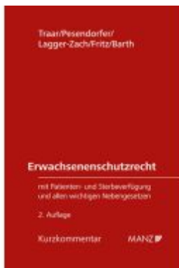
Erwachsenenschutzrecht Ladenpreis: 148,00EUR