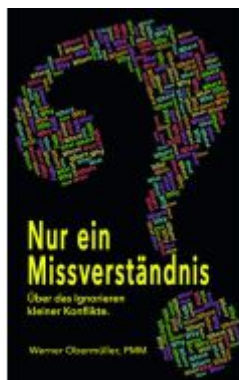
Nur ein Missverständnis?