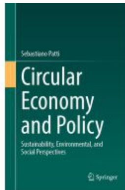
Circular Economy and Policy Ladenpreis: 109,99EUR