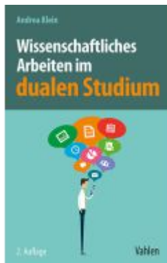
Wissenschaftliches Arbeiten im dualen Studium Ladenpreis: 20,40EUR