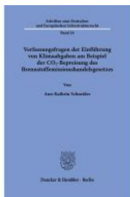
Verfassungsfragen der Einführung von Klimaabgaben am Beispiel der CO 2 -Bepreisung des Brennstoffemissionshandelsgesetzes