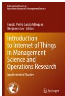
Introduction to Internet of Things in Management Science and Operations Research

Wir haben andere Produkte gefunden, die Ihnen gefallen könnten!