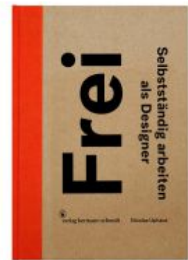
Frei Ladenpreis: 46,30EUR