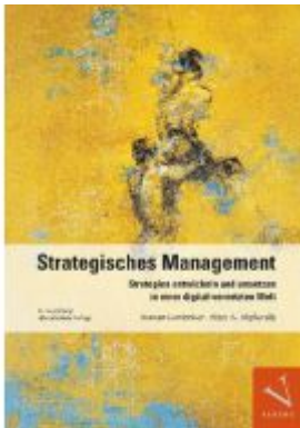
Strategisches Management Ladenpreis: 78,00EUR