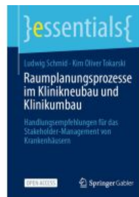
Raumplanungsprozesse im Klinikneubau und Klinikumbau