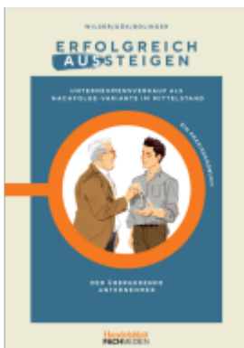
Erfolgreich aus- und einsteigen Ladenpreis: 41,10EUR