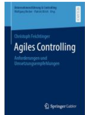
Agiles Controlling Ladenpreis: 71,95EUR