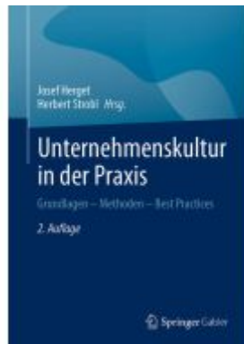
Unternehmenskultur in der Praxis Ladenpreis: 71,95EUR