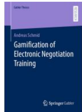
Gamification of Electronic Negotiation Training Ladenpreis: 109,99EUR