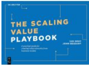
The Scaling Value Playbook Ladenpreis: 29,95EUR