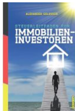
Steuerleitfaden für Immobilieninvestoren Ladenpreis: 34,90EUR