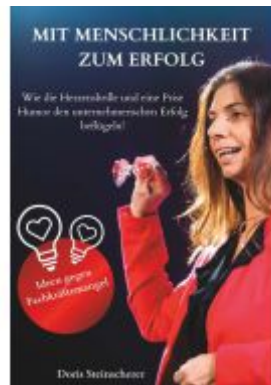
MIT MENSCHLICHKEIT ZUM ERFOLG Ladenpreis: 19,90EUR