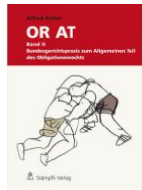
Schweizerisches Obligationenrecht Allgemeiner Teil Ladenpreis: 135,20EUR