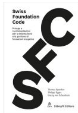
Swiss Foundation Code 2021 Ladenpreis: 56,50EUR