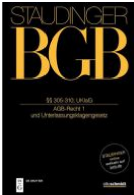
§§ 305-310; UKlaG Ladenpreis: 429,00EUR