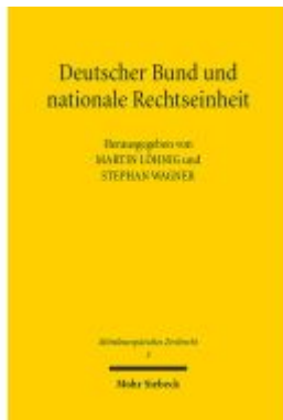
Deutscher Bund und nationale Rechtseinheit Ladenpreis: 91,50EUR

Wir haben andere Produkte gefunden, die Ihnen gefallen könnten!