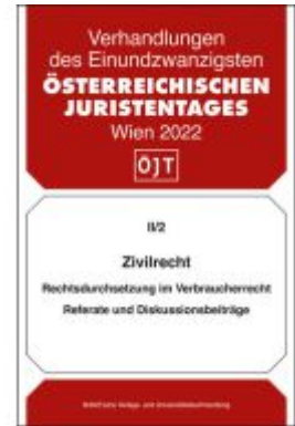
Zivilrecht Ladenpreis: 44,00EUR