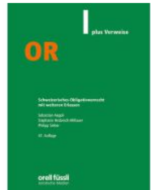
OR plus Verweise Ladenpreis: 38,00EUR