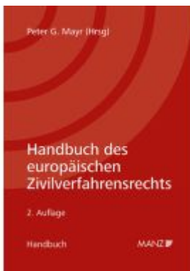
Handbuch des europäischen Zivilverfahrensrechts Ladenpreis: 268,00EUR