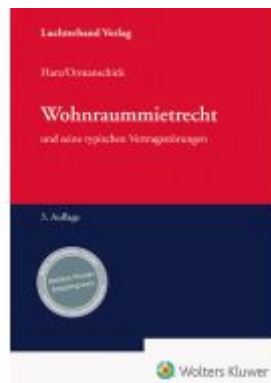
Wohnraummietrecht und seine typischen Vertragsstörungen Ladenpreis: 71,00EUR