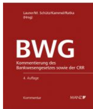
Bankwesengesetz - BWG 4.Auflage Ladenpreis: 438,00EUR