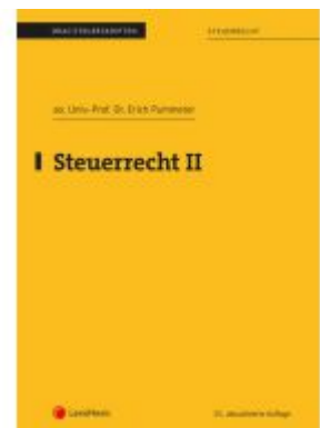
Steuerrecht II (Skriptum) Ladenpreis: 18,75EUR