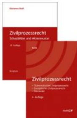
PAKET: Zivilprozessrecht 4.Auflage+ Zivilprozessrecht Schaubilder und Aktenmuster 14.Auflage Ladenpreis: 77,40EUR