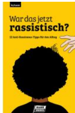
War das jetzt rassistisch? Ladenpreis: 23,50EUR