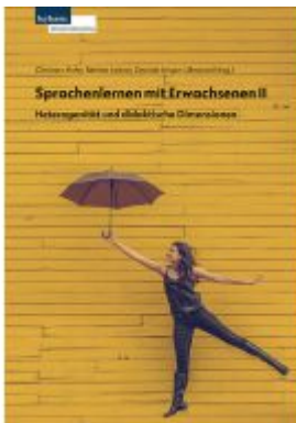
Sprachenlernen mit Erwachsenen II Ladenpreis: 28,00EUR