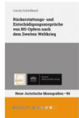
Rückerstattungs- und Entschädigungsansprüche von NS-Opfern nach dem Zweiten Weltkrieg Ladenpreis: 78,00EUR