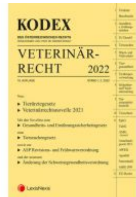
KODEX Veterinärrecht 2022 Ladenpreis: 96,00EUR