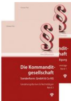
Die Kommanditgesellschaft Set: Band 1 +2 Ladenpreis: 109,00EUR