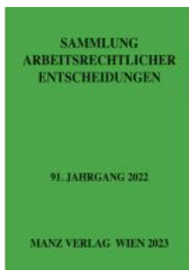
Sammlung arbeitsrechtlicher Entscheidungen Ladenpreis: 266,00EUR