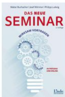
Das neue Seminar Ladenpreis: 29,90EUR