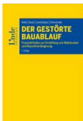
Der gestörte Bauablauf Ladenpreis: 89,00EUR