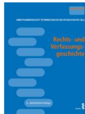
Rechts- und Verfassungsgeschichte Ladenpreis: 44,00EUR