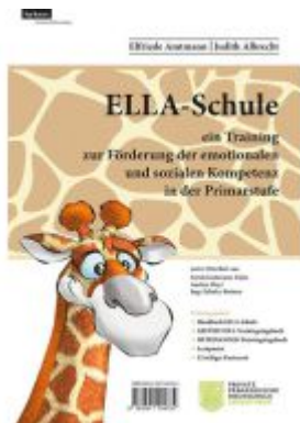
ELLA - Schule - ein Training zur Förderung der emotionalen und sozialen Kompetenz in der Primarstufe Ladenpreis: 42,00EUR