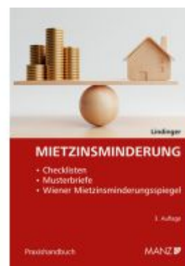
Mietzinsminderung Ladenpreis: 48,00EUR