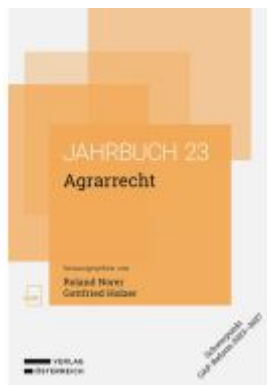
Agrarrecht Ladenpreis: 78,00EUR