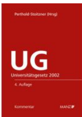
Kommentar zum Universitätsgesetz 2002 Ladenpreis: 198,00EUR