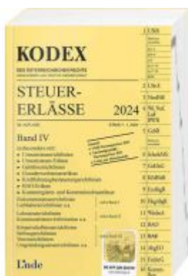
KODEX Steuer-Erlässe 2024, Band IV Ladenpreis: 66,00EUR