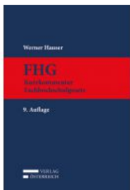
FHG Kurzkommentar Fachhochschulgesetz Aktionspreis: 99,00 EUR Ladenpreis: 119,00 EUR