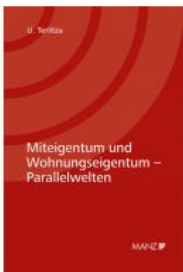
Miteigentum und Wohnungseigentum - Parallelwelten Ladenpreis: 132,00 EUR