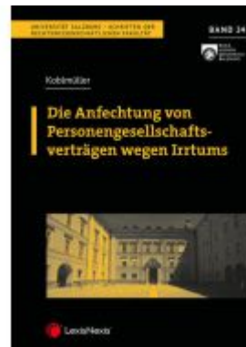
Die Anfechtung von Personengesellschaftsverträgen wegen Irrtums Ladenpreis: 32,00 EUR