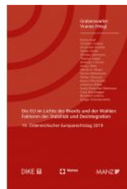
Die EU im Lichte des Brexits und der Wahlen Europarechtstag 2019 Ladenpreis: 58,00 EUR

Alle Preise inkl. MwSt. zzgl. Versand. Bei Bestellung im LexisNexis Onlineshop kostenloser Versand innerhalb Österreichs.