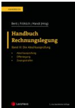
Handbuch Rechnungslegung / Handbuch Rechnungslegung, Band III: Die Abschlussprüfung Ladenpreis: 110,00 EUR

Wir haben andere Produkte gefunden, die Ihnen gefallen könnten!