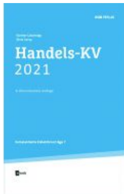
Handels-KV 2021 Ladenpreis: 36,00 EUR