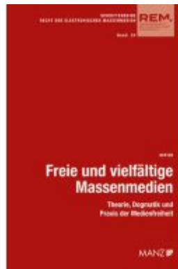
Freie und vielfältige Massenmedien Ladenpreis: 89,00EUR