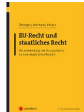
EU-Recht und staatliches Recht Ladenpreis: 54,00EUR

Wir haben andere Produkte gefunden, die Ihnen gefallen könnten!