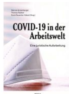
COVID-19 in der Arbeitswelt Ladenpreis: 45,00EUR