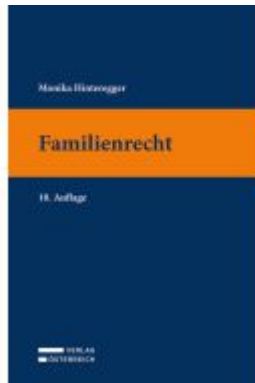
Familienrecht Ladenpreis: 28,00EUR