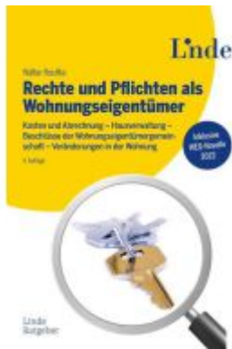
Rechte und Pflichten als Wohnungseigentümer Ladenpreis: 48,00EUR