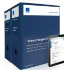
Mustersammlung Verwaltungsverfahren Ladenpreis: 261,80EUR