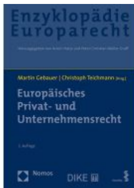
Europäisches Privat- und Unternehmensrecht Ladenpreis: 193,30EUR