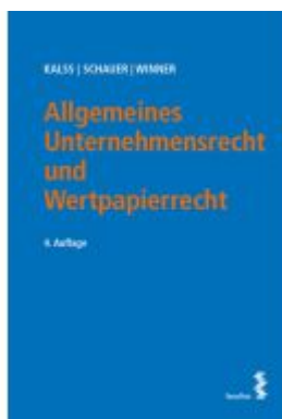
Allgemeines Unternehmensrecht und Wertpapierrecht Ladenpreis: 54,00EUR