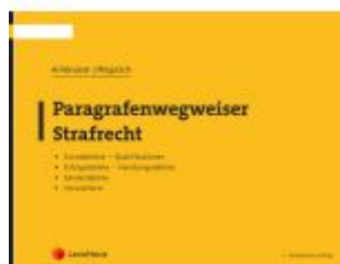
Paragrafenwegweiser Strafrecht Ladenpreis: 17,50EUR