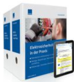
Elektrosicherheit in der Praxis Ladenpreis: 273,90EUR