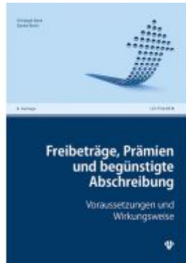
Freibeträge, Prämien und begünstigte Abschreibung Ladenpreis: 29,00EUR