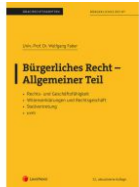
Bürgerliches Recht - Allgemeiner Teil (Skriptum) Ladenpreis: 26,25EUR