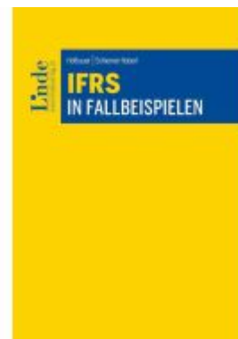
IFRS in Fallbeispielen Ladenpreis: 58,00EUR