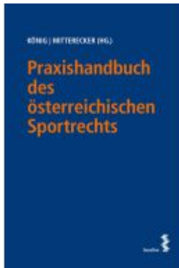
Praxishandbuch des österreichischen Sportrechts Ladenpreis: 220,00EUR