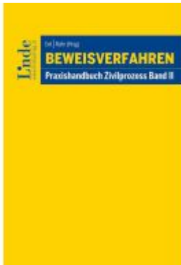
Beweisverfahren Ladenpreis: 109,00EUR