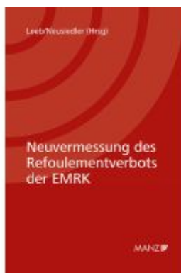
Neuermessung des Refoulementverbots der EMRK Ladenpreis: 39,00EUR