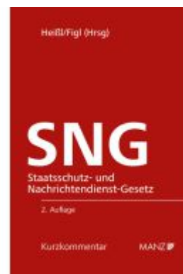
Staatsschutz- und Nachrichtendienst-Gesetz SNG Ladenpreis: 84,00EUR