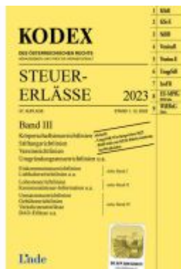
KODEX Steuer-Erlässe 2023, Band III Ladenpreis: 62,00EUR

Wir haben andere Produkte gefunden, die Ihnen gefallen könnten!