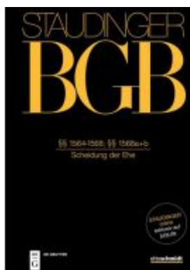
J. von Staudingers Kommentar zum Bürgerlichen Gesetzbuch mit Einführungsgesetz... / §§ 1564-1568b Ladenpreis: 199,95EUR