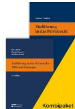
Kombipaket Einführung in das Privatrecht: Lehrbuch und Casebook Ladenpreis: 45,00EUR