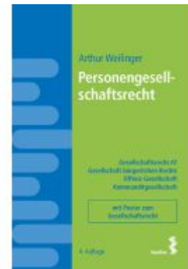
Personengesellschaftsrecht Ladenpreis: 28,00EUR