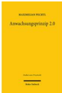
Anwachungsprinzip 2.0 Ladenpreis: 112,10EUR