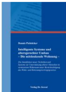
Intelligente Systeme und altersgerechter Umbau – Die mitdenkende Wohnung – Ladenpreis: 102,60EUR