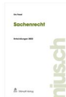
Sachenrecht Ladenpreis: 81,20EUR