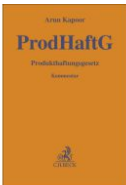
Produkthaftungsgesetz Ladenpreis: 112,10EUR

Wir haben andere Produkte gefunden, die Ihnen gefallen könnten!