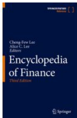
Encyclopedia of Finance Ladenpreis: 659,99EUR