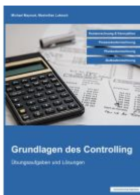
Grundlagen des Controlling Ladenpreis: 10,30EUR