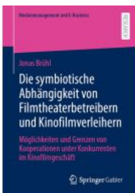
Die symbiotische Abhängigkeit von Filmtheaterbetreibern und Kinofilmverleihern Ladenpreis: 77,09EUR