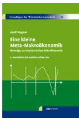
Eine kleine Meta-Makroökonomik Ladenpreis: 35,80EUR