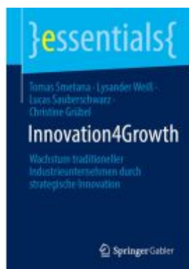
Innovation for Growth Ladenpreis: 15,41EUR