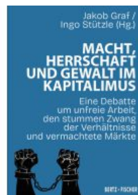
Macht, Herrschaft und Gewalt im Kapitalismus Ladenpreis: 12,40EUR