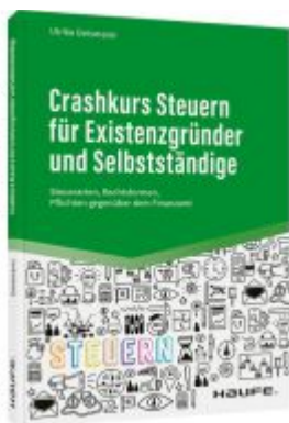
Crashkurs Steuern für Existenzgründer und Selbstständige Ladenpreis: 25,70EUR