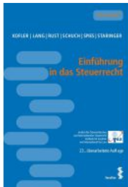
Einführung in das Steuerrecht Ladenpreis: 24,00EUR