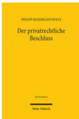
Der privatrechtliche Beschluss Ladenpreis: 123,40EUR