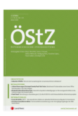
ÖstZ Zeitschrift - Jahres-Abonnement (24 Hefte) Ladenpreis: 0,00EUR