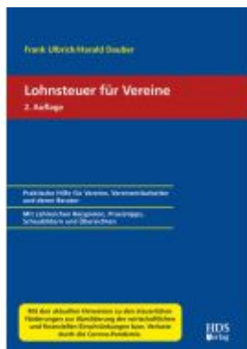
Lohnsteuer für Vereine Ladenpreis: 46,20EUR