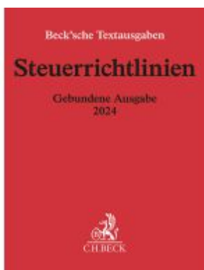
Steuerrichtlinien Gebundene Ausgabe 2024 Ladenpreis: 60,70EUR