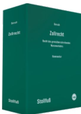
Zollrecht Kommentar Ladenpreis: 237,60EUR