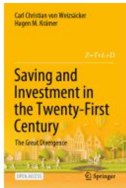
Saving and Investment in the Twenty-First Century Ladenpreis: 43,99EUR