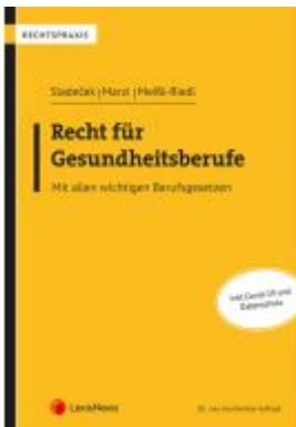
Recht für Gesundheitsberufe Ladenpreis: 48,00EUR