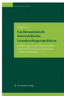
Liechtensteinisch-österreichische Grundrechtsperspektiven Ladenpreis: 39,90EUR