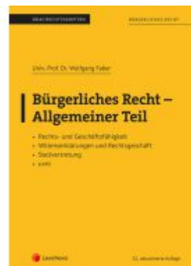
Bürgerliches Recht - Allgemeiner Teil (Skriptum) Ladenpreis: 26,25EUR