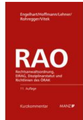
Rechtsanwaltsordnung RAO Ladenpreis: 210,00EUR