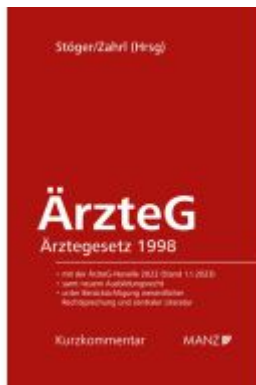
ÄrzteG - Ärztegesetz 1998 Ladenpreis: 175,00EUR