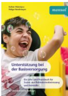
Unterstützung bei der Basisversorgung Ladenpreis: 26,90EUR

Wir haben andere Produkte gefunden, die Ihnen gefallen könnten!