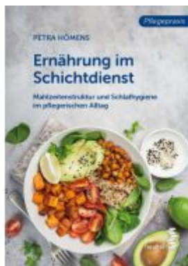
Ernährung im Schichtdienst Ladenpreis: 18,90EUR