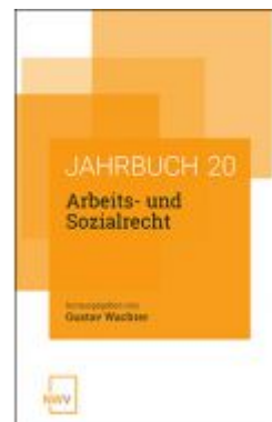
Arbeits- und Sozialrecht Ladenpreis: 54,00 EUR