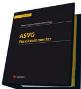
ASVG Praxiskommentar Ladenpreis: 315,00 EUR