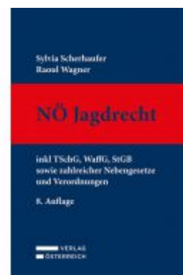
Nö Jagdrecht Ladenpreis: 189,00 EUR