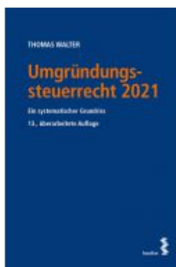
Umgründungssteuerrecht 2021 Ladenpreis: 64,00 EUR