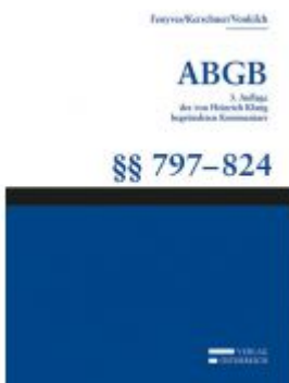
Großkommentar zum ABGB - Klang Kommentar Ladenpreis: 145,00 EUR

Wir haben andere Produkte gefunden, die Ihnen gefallen könnten!