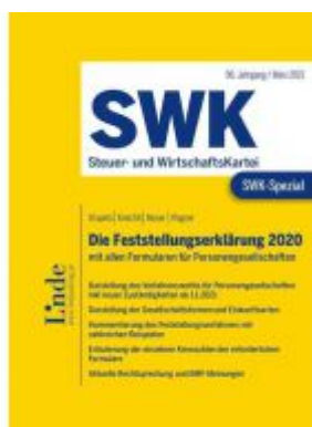
SWK-Spezial Die Feststellungserklärung 2020 Ladenpreis: 48,00 EUR