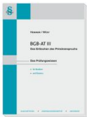
BGB AT III - Das Erlöschen des Primäranspruchs Ladenpreis: 23,60EUR