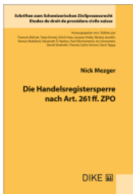
Die Handelsregistersperre nach Art. 261 ff. ZPO Ladenpreis: 90,00EUR