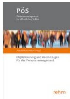
Digitalisierung und deren Folgen für das Personalmanagement Ladenpreis: 30,90EUR