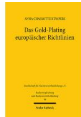
Das Gold-Plating europäischer Richtlinien Ladenpreis: 60,70EUR