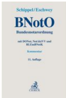
BNotO. Bundesnotarordnung Ladenpreis: 173,80EUR

Wir haben andere Produkte gefunden, die Ihnen gefallen könnten!