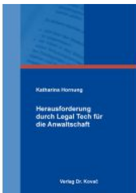
Herausforderung durch Legal Tech für die Anwaltschaft Ladenpreis: 82,10EUR