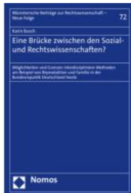
Eine Brücke zwischen den Sozial- und Rechtswissenschaften? Ladenpreis: 71,00EUR