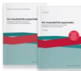
Der Haushaltsführungsschaden – Kombipaket Ladenpreis: 75,90EUR