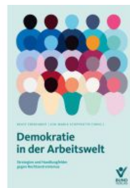
Demokratie in der Arbeitswelt Ladenpreis: 22,70EUR