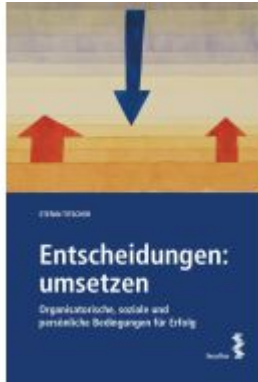
Entscheidungen: umsetzen Ladenpreis: 38,00EUR