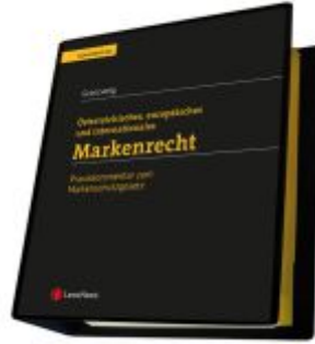
Markenrecht - Praxiskommentar zum Markenschutzgesetz Ladenpreis: 275,00EUR