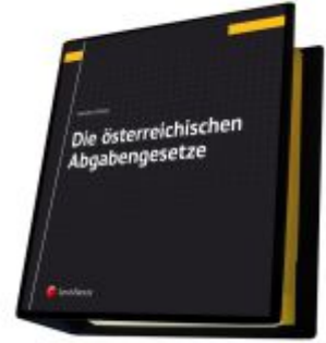
Die österreichischen Abgabengesetze Ladenpreis: 142,00EUR