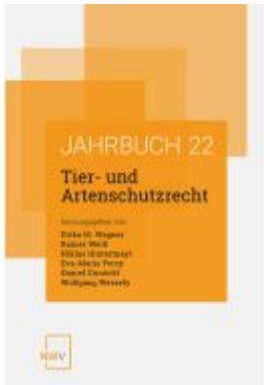
Tier- und Artenschutzrecht Ladenpreis: 84,00EUR