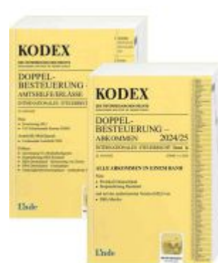
KODEX Doppelbesteuerung 2024 Ladenpreis: 73,00EUR