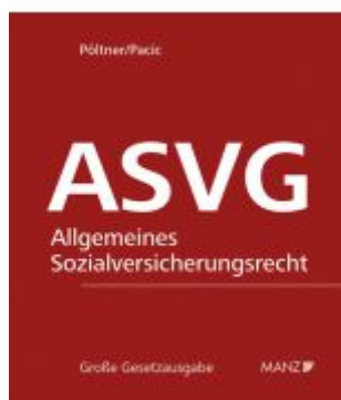
Allgemeine Sozialversicherung ASVG Ladenpreis: 338,00EUR