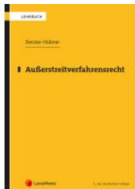
Außerstreitverfahrensrecht Ladenpreis: 26,00EUR