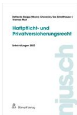
Haftpflicht- und Privatversicherungsrecht Ladenpreis: 81,20EUR