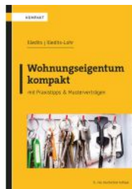
Wohnungseigentum kompakt Ladenpreis: 46,00EUR