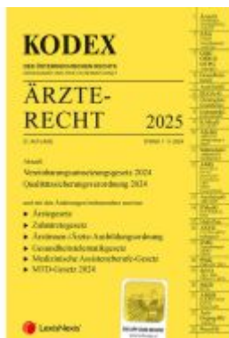
KODEX Ärztereht 2025 - inkl. App Ladenpreis: 99,00EUR

Wir haben andere Produkte gefunden, die Ihnen gefallen könnten!