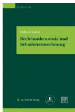
Rechtsankennnis und Schadenszurechnung Ladenpreis: 55,00EUR