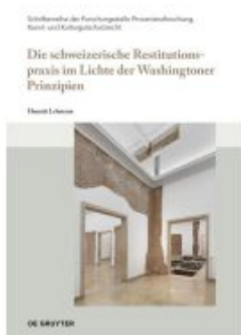
Die schweizerische Restitutionspraxis im Lichte der Washingtoner Prinzipien Ladenpreis: 99,00EUR