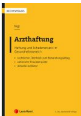
Arzthaftung Ladenpreis: 74,00EUR