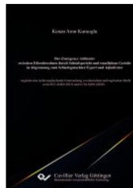
Der Emergency Arbitrator zwischen Eilrechtsschutz durch Schiedsgericht und staatlichem Gericht in Abgrenzung zum Schiedsgutachter/Expert und Adjudicator Ladenpreis: 117,10EUR