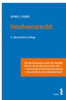
Insolvenzrecht Ladenpreis: 36,00EUR