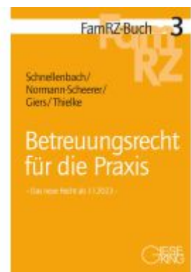
Betreuungsrecht für die Praxis Ladenpreis: 71,00EUR