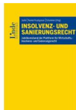
Insolvenz- und Sanierungsrecht Ladenpreis: 69,00EUR