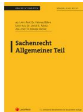
Sachenrecht Allgemeiner Teil (Skriptum) Ladenpreis: 23,75EUR