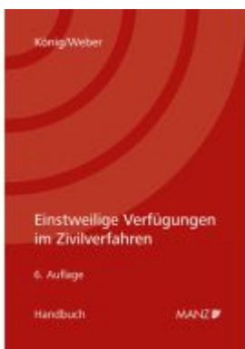
Einstweilige Verfügungen im Zivilverfahren Ladenpreis: 94,00EUR