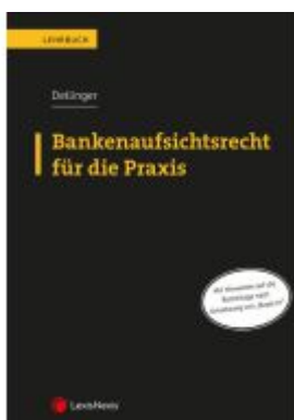
Bankenaufsichtsrecht für die Praxis Ladenpreis: 59,00EUR