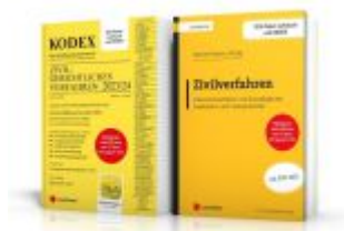
PAKET ZGV - Lehrbuch Zivilverfahren & Kodex ZGV Ladenpreis: 75,00EUR

Wir haben andere Produkte gefunden, die Ihnen gefallen könnten!