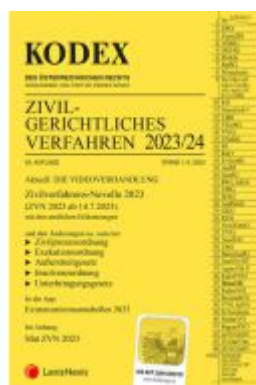
KODEX Zivilgerichtliches Verfahren 2023/24 - inkl. App Ladenpreis: 43,00EUR