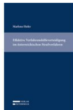
Effektive Verfahrenshilfeverteidigung im österreichischen Strafverfahren Ladenpreis: 79,00EUR