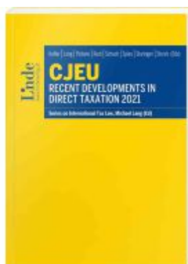
CJEU - Recent Developments in Direct Taxation 2021 Ladenpreis: 85,00EUR