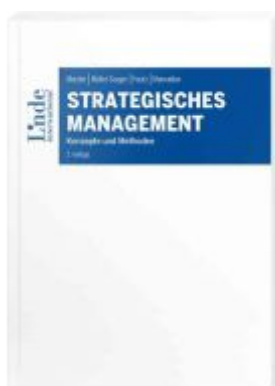
Strategisches Management Ladenpreis: 40,00EUR