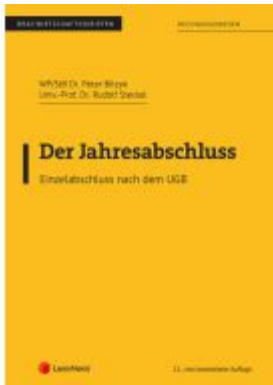
Der Jahresabschluss - Einzelabschluss nach dem UGB Ladenpreis: 22,50EUR