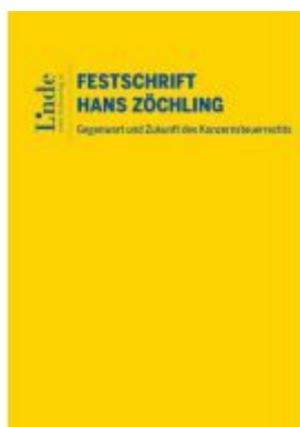
Gegenwart und Zukunft des Konzernsteuerrechts – Festschrift für Hans Zöchling Ladenpreis: 138,00EUR