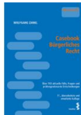
Casebook Bürgerliches Recht Ladenpreis: 48,00EUR