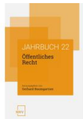
Öffentliches Recht Ladenpreis: 84,00EUR