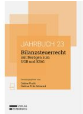
Bilanzsteuerrecht mit Bezügen zum UGB und KStG Ladenpreis: 62,00EUR