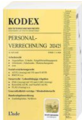
KODEX Personalverrechnung 2024/25 Ladenpreis: 45,00EUR