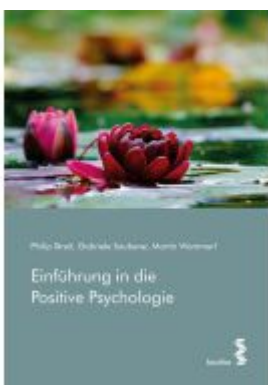
Einführung in die Positive Psychologie Ladenpreis: 24,90EUR