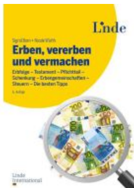
Erben, vererben und vermachen Ladenpreis: 16,90EUR

Wir haben andere Produkte gefunden, die Ihnen gefallen könnten!