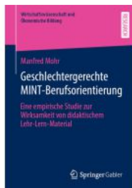
Geschlechtergerechte MINT-Berufsorientierung Ladenpreis: 82,24EUR