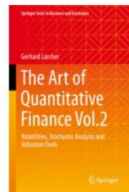
The Art of Quantitative Finance Vol.2 Ladenpreis: 142,99EUR