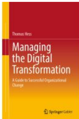
Managing the Digital Transformation Ladenpreis: 54,99EUR

Wir haben andere Produkte gefunden, die Ihnen gefallen könnten!