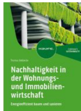
Nachhaltigkeit in der Wohnungs- und Immobilienwirtschaft Ladenpreis: 72,00EUR