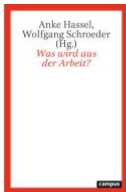
Was wird aus der Arbeit? Ladenpreis: 29,90EUR