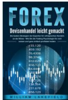
FOREX - Devisenhandel leicht gemacht: Die besten Strategien der Experten für erfolgreiches Handeln an der Börse - Wie Sie die Trading Psychologie für sich nutzen und ganz einfach profitabel traden Ladenpreis: 16,40EUR