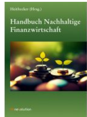
Handbuch Nachhaltige Finanzwirtschaft Ladenpreis: 61,30EUR