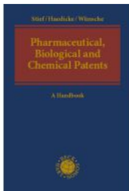
Pharmaceutical, Biological and Chemical Patents Ladenpreis: 205,70EUR