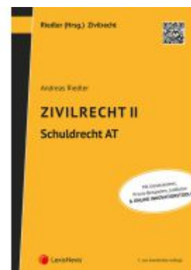
Zivilrecht II - Schuldrecht Allgemeiner Teil Ladenpreis: 42,00EUR