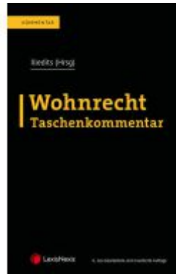
Wohnrecht Taschenkommentar Ladenpreis: 229,00EUR