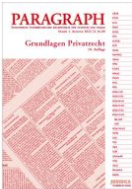
Paragraph - Grundlagen Privatrecht Ladenpreis: 16,90EUR