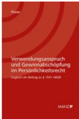
Verwendungsanspruch und Gewinnabschöpfung im Persönlichkeitsrecht Ladenpreis: 44,00EUR