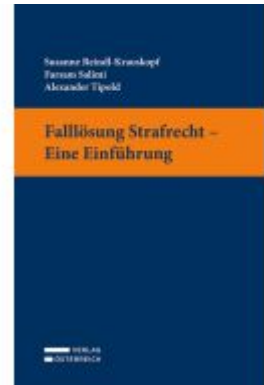
Falllösung Strafrecht - Eine Einführung Ladenpreis: 32,00EUR