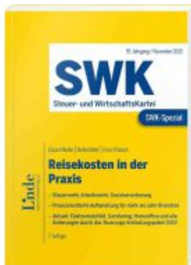
SWK-Spezial Reisekosten in der Praxis Ladenpreis: 39,00EUR

Wir haben andere Produkte gefunden, die Ihnen gefallen könnten!