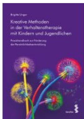
Kreative Methoden in der Verhaltenstherapie mit Kindern und Jugendlichen Ladenpreis: 23,90EUR