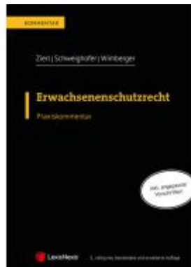
Erwachsenenschutzrecht Ladenpreis: 129,00EUR