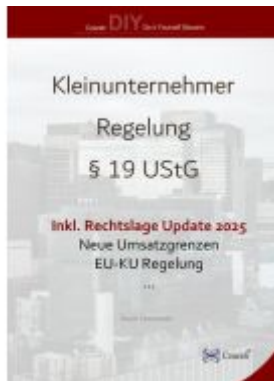
Kleinunternehmerregelung §19 UStG ab 2025 Ladenpreis: 4,10EUR