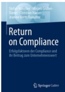
Return on Compliance Ladenpreis: 28,77EUR