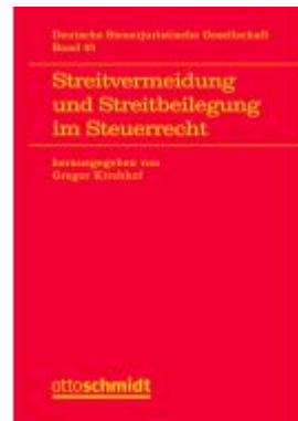
Streitvermeidung und Streitbeilegung im Steuerrecht Ladenpreis: 92,40EUR