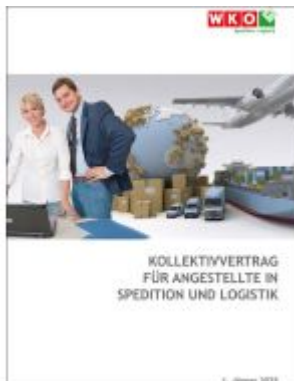
Kollektivvertrag für Angestellte in Spedition und Logistik Ladenpreis: 6,50EUR