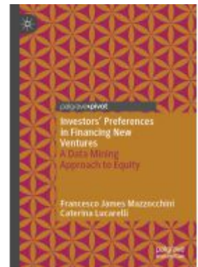
Investors' Preferences in Financing New Ventures Ladenpreis: 54,99EUR