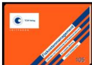
Fixkostenmanagement Ladenpreis: 257,10EUR