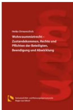
Wohnraummietrecht – Zustandekommen, Rechte und Pflichten der Beteiligten, Beendigung und Abwicklung Ladenpreis: 66,80EUR