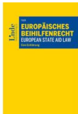
Europäisches Beihilfenrecht I European State Aid Law Ladenpreis: 49,00EUR