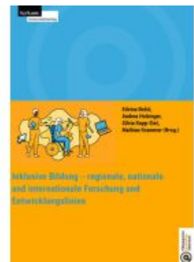
Inklusive Bildung - regionale, nationale und internationale Forschung und Entwicklungslinien Ladenpreis: 31,00EUR

Alle Preise inkl. MwSt. zzgl. Versand. Bei Bestellung im LexisNexis Onlineshop kostenloser Versand innerhalb Österreichs.