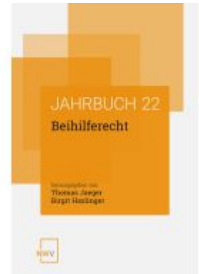
Beihilferecht Ladenpreis: 88,00EUR