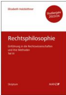
Rechtsphilosophie Einführung in die Rechtswissenschaften und ihre Methoden: Teil III Ladenpreis: 15,40EUR