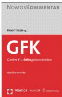
Genfer Flüchtlingskonvention Ladenpreis: 128,00EUR