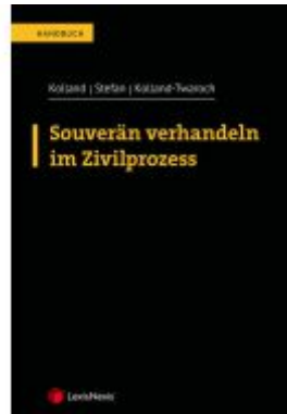
Souverän verhandeln im Zivilprozess Ladenpreis: 239,00EUR