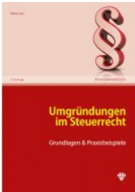
Umgründungen im Steuerrecht Ladenpreis: 59,40EUR