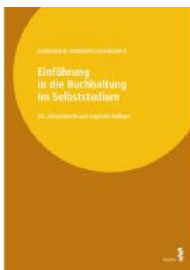
Einführung in die Buchhaltung im Selbststudium Ladenpreis: 52,00EUR