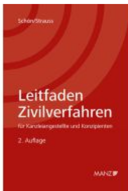
Leitfaden Zivilverfahren für Kanzleiangestellte und Konzipienten Ladenpreis: 29,00EUR