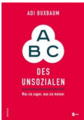
ABC des Unsozialen Ladenpreis: 24,90EUR

Wir haben andere Produkte gefunden, die Ihnen gefallen könnten!