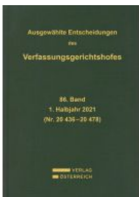
Ausgewählte Entscheidungen des Verfassungsgerichtshofes Ladenpreis: 419,00EUR