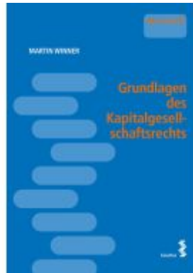
Grundlagen des Kapitalgesellschaftsrechts Ladenpreis: 18,00EUR