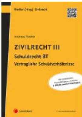
Zivilrecht III - Schuldrecht Besonderer Teil - Vertragliche Schuldverhältnisse Ladenpreis: 35,00EUR