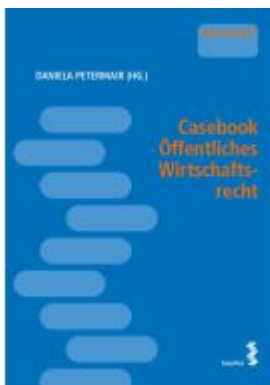
Casebook Öffentliches Wirtschaftsrecht Ladenpreis: 28,00EUR