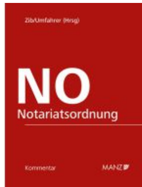
Notariatsordnung Ladenpreis: 260,00EUR