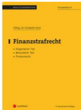
Finanzstrafrecht (Skriptum) Ladenpreis: 28,75EUR

Wir haben andere Produkte gefunden, die Ihnen gefallen könnten!