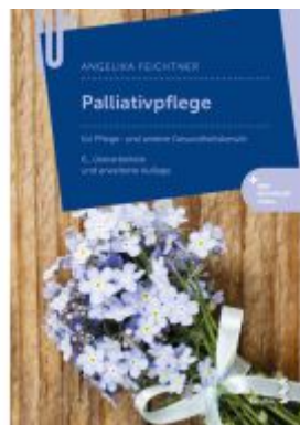
Palliativpflege Ladenpreis: 38,90EUR