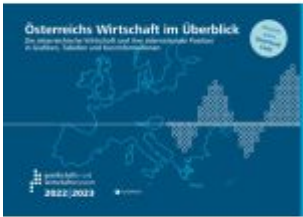
Österreichs Wirtschaft im Überblick 2022/23 Ladenpreis: 14,30EUR