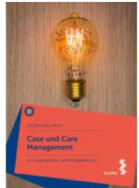
Case und Care Management Ladenpreis: 24,90EUR