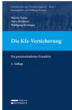
Die Kfz-Versicherung Ladenpreis: 69,00EUR