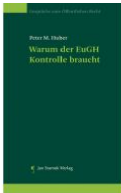
Warum der EuGH Kontrolle braucht Ladenpreis: 24,90EUR