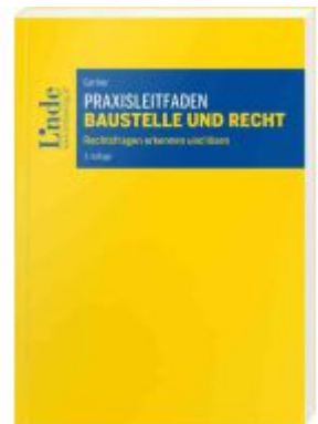
Praxisleitfaden Baustelle und Recht Ladenpreis: 38,00EUR