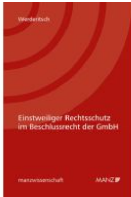
Einstweiliger Rechtsschutz im Beschlussrecht der GmbH Ladenpreis: 48,00EUR