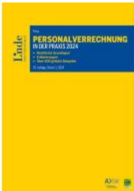
Personalverrechnung in der Praxis 2024 Ladenpreis: 120,00EUR