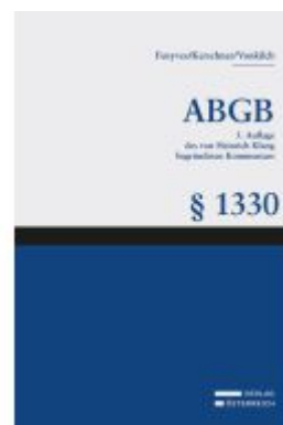
Großkommentar zum ABGB - Klang Kommentar Ladenpreis: 200,00EUR