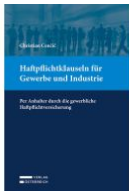
Haftpflichtklauseln für Gewerbe und Industrie Ladenpreis: 49,00EUR

Wir haben andere Produkte gefunden, die Ihnen gefallen könnten!