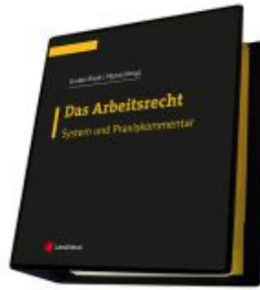
Das Arbeitsrecht - System und Praxiskommentar Ladenpreis: 348,00EUR