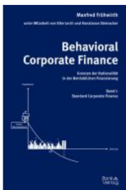
Behavioral Corporate Finance - Grenzen der Rationalität in der Betrieblichen Finanzierung Ladenpreis: 47,00EUR