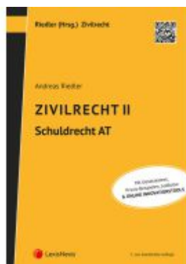
Zivilrecht II - Schuldrecht Allgemeiner Teil Ladenpreis: 42,00EUR