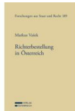
Richterbestellung in Österreich Ladenpreis: 114,00EUR