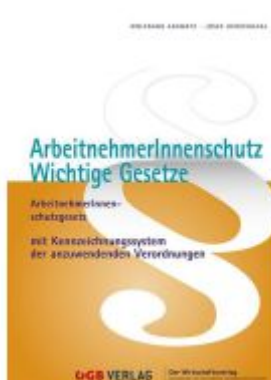
ArbeitnehmerInnenschutz. Ladenpreis: 72,80EUR