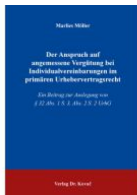
Der Anspruch auf angemessene Vergütung bei Individualvereinbarungen im primären Urhebervertragsrecht Ladenpreis: 101,60EUR