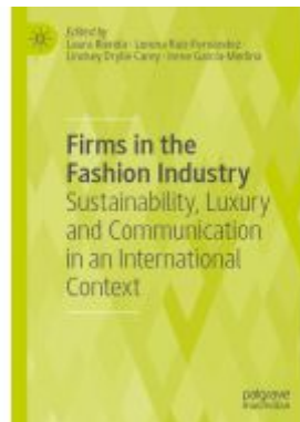
Firms in the Fashion Industry Ladenpreis: 175,99EUR