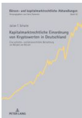
Kapitalmarktrechtliche Einordnung von Kryptowerten in Deutschland Ladenpreis: 56,50EUR