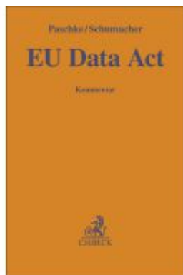
EU Data Act Ladenpreis: 153,20EUR