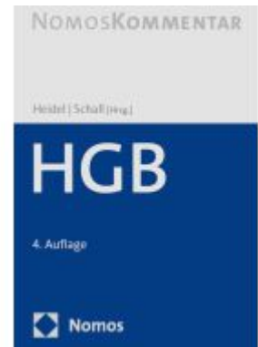
Handelsgesetzbuch: HGB Ladenpreis: 184,10EUR