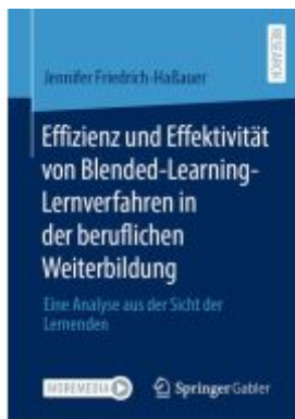
Effizienz und Effektivität von Blended- Learning-Lernverfahren in der beruflichen Weiterbildung Ladenpreis: 92,51EUR