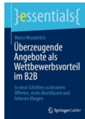
Überzeugende Angebote als Wettbewerbsvorteil im B2B Ladenpreis: 15,41EUR