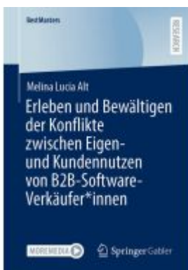
Erleben und Bewältigen der Konflikte zwischen Eigen- und Kundennutzen von B2B-Software-Verkäufer*innen Ladenpreis: 71,95EUR