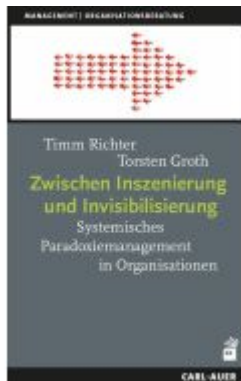
Zwischen Inszenierung und Invisibilisierung Ladenpreis: 30,80EUR

Wir haben andere Produkte gefunden, die Ihnen gefallen könnten!